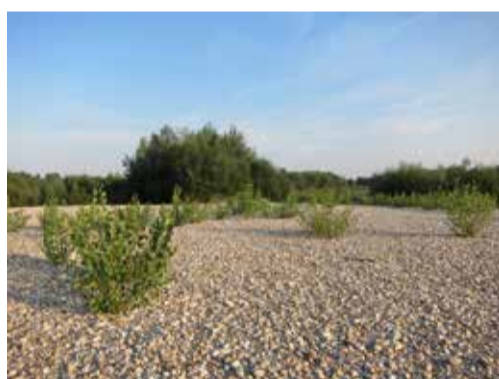
Na novonastalim sprudovima prirodnih rijeka rastu pionirske biljne vrste