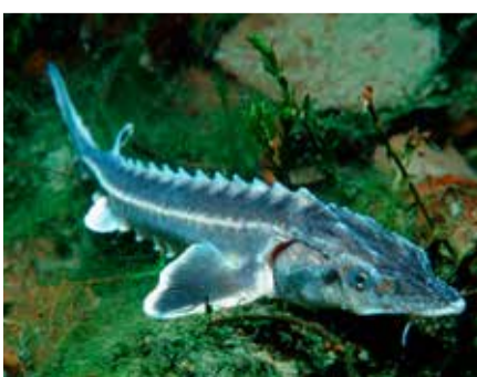
Prirodna poplavna područja potrebna su kako bi zaštitili iznimne vrste poput orla štekavca te prirodne očuvane rijeke bez brana kako bi zaštitili jesetre