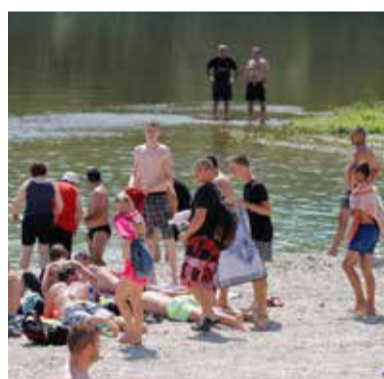
Prirodne rijeke lokalnom stanovništvu nude prostor za opuštanje i temelj su eko turizmu